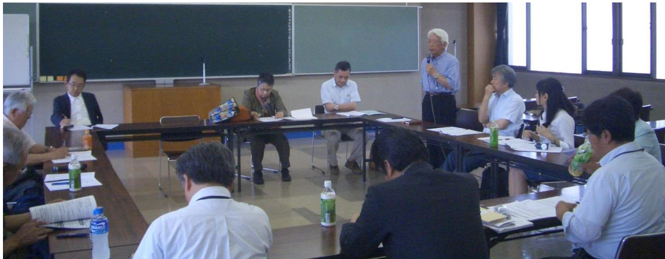
▲「戦争をさせない1000人委員会・信州」の正式発足を確認した発起人会議。