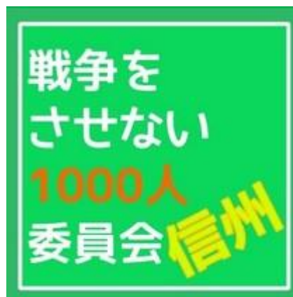
▲ロゴマークもできました。